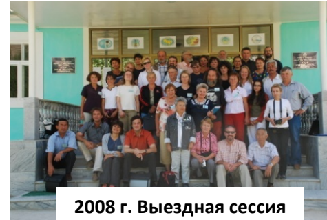
2008 г. Выездная сессия девонской подкомиссии