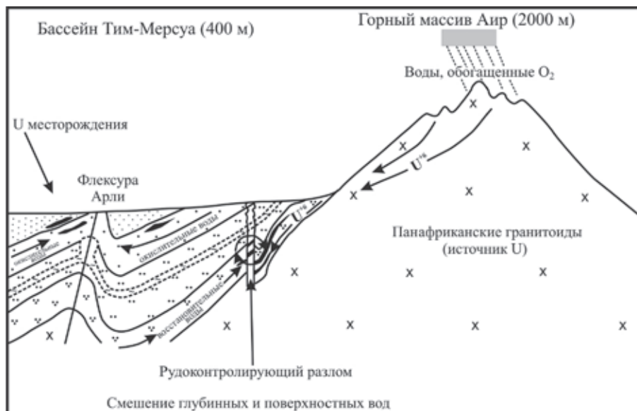
Рис. 5. Принципиальная схема формирования уранового оруденения в проницаемых осадочных породах бассейна Тим-Мерсуа [17]

этих месторождений по сравнению с нормальными песчаниковыми месторождениями в рыхлых отложениях. Образование месторождений бихорского типа возможно также на нижних горизонтах артезианского бассейна Плато Колорадо, в частности среди отложений пермской формации Катлер, в надинтрузивных ореолах ларамийских лакколлитов, концентрирующихся в центральной части мозаично-блоковой структуры.