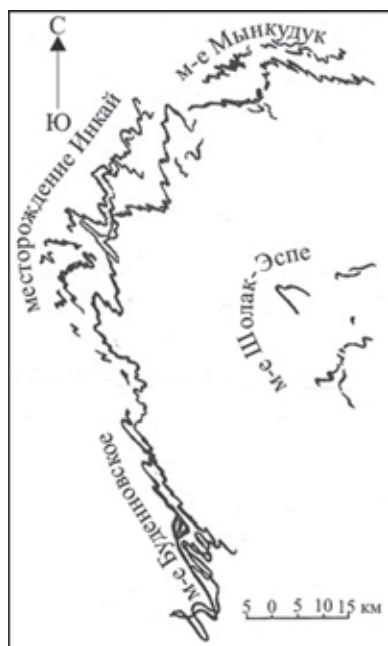
Рис. 3. Урановорудные залежи Инкай-Мынкудукского рудного пояса [12]

Металлогенические зоны (региональные редокс-фронты): I – Инкай-Мынкудукская, II – Канжуган-Моинкумская, III – Эспе-Кокшетауская, IV – Акдала-Уванаская, V – Карамурунская