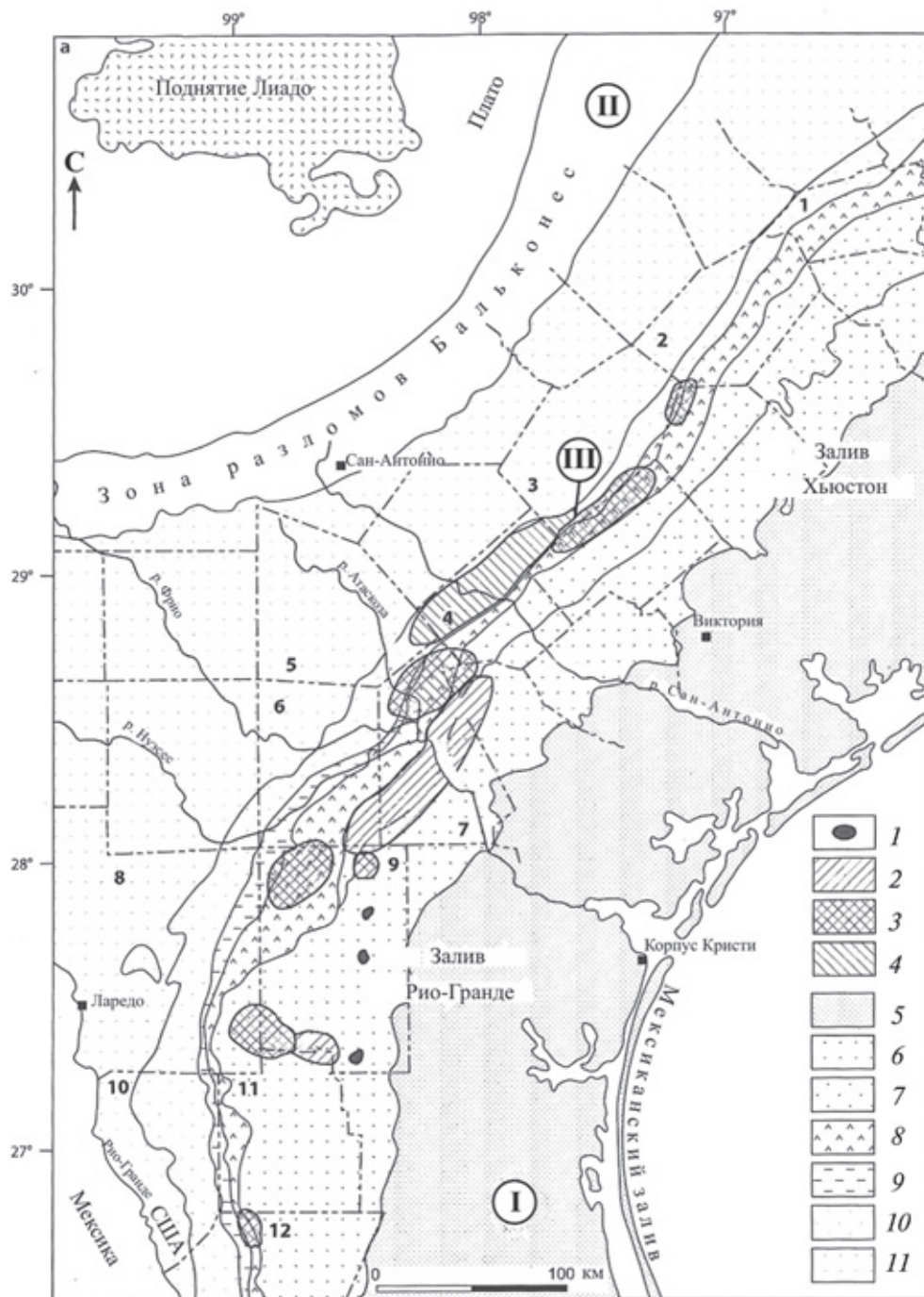
Рис. 4. Генерализованная геологическая карта прибрежной равнины Южного Техаса с размещением урановорудных районов [15]

Районы с месторождениями урана в отложениях формаций: 1 – голиад (плиоцен), 2 – оаквилль (миоцен), 3 – катахоула (олигоцен), 4 – джексон (верхний эоцен). Породы месторождений урана: 5 – породы голоцена и плейстоцена; 6 – свита голиад (плейстоцен); 7 – песчаники Оаквилль и свита флеминг (миоцен); 8 – свита катахоула (олигоцен); 9 – глины фрио (олигоцен?); 10 – группа джексон (верхний эоцен); 11 – породы свиты джексон (эоцен, палеоцен, верхний мел). Главные тектонические нарушения: I – граница нефтегазоносного бассейна Мексиканского залива; II – зона разломов Бальконес; III – зона разломов Эдвардс, контролирующая положение уранового минерального пояса Южного Техаса