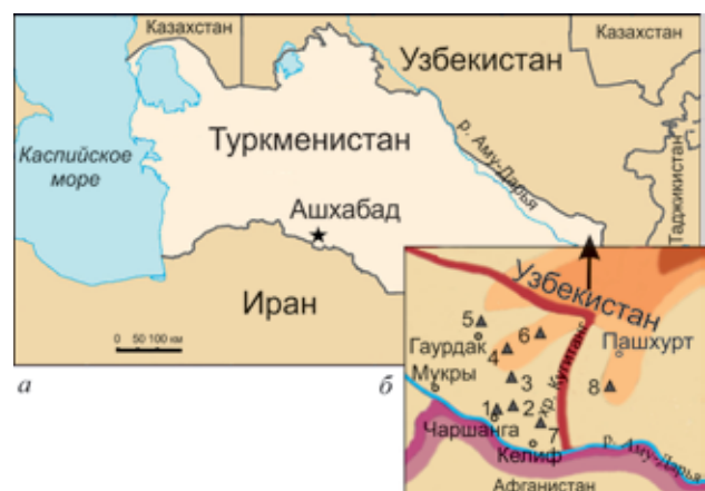
Рис. 1. Карта-схема расположения изученных разрезов в Гаурдак-Кугитангском районе Туркменистана: а — Туркменистан; б — Гаурдак-Кугитангский район (1 — Кундалианг, 2 — Каттаур, 3 — Габба, 4 — Огулбек, 5 — Кансай, 6 — Бегляр, 7 — Кампрекское устье, 8 — Газдагана)

Наибольшим стратиграфическим значением обладает вид C. regularis (d'Orb), который образует скопления в узком стратиграфическом интервале